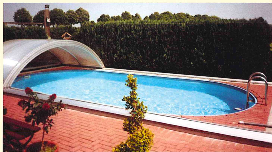
Ein Oval-Schwimmbecken mit einer SIEGER-Überdachung.

Schwimmbad-/Grundstücks-Besitzer unterliegen einer permanenten Verkehrssicherungspflicht,